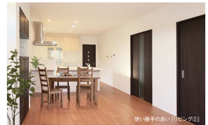
使い勝手の良い「リビング②」