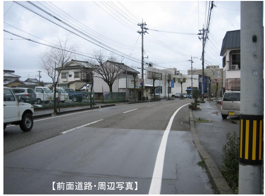
【前面道路・周辺写真】