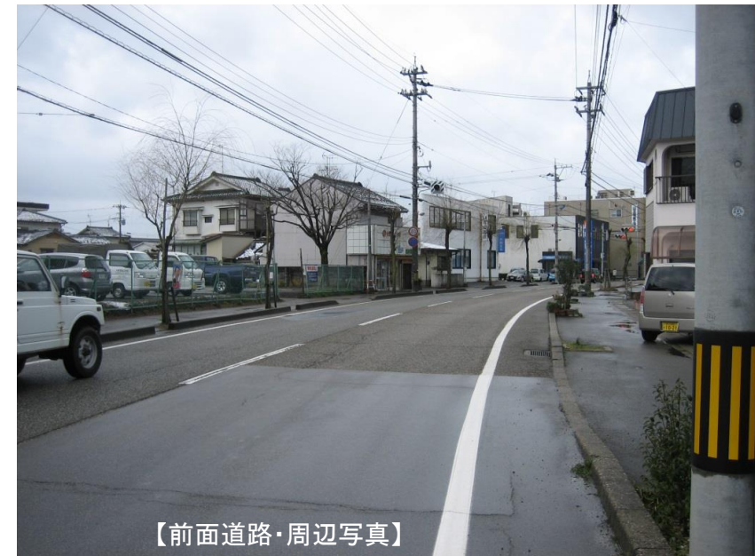
【前面道路・周辺写真】